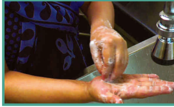
5. नाखूनों की सफाई