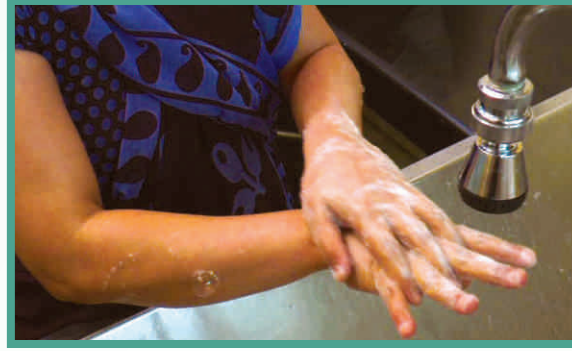
2. हाथों के पीछे