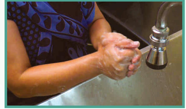
3. मुट्टी बनाकर हाथों को मलें